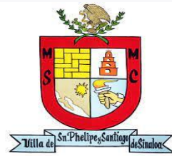
SINALOA DE LEYVA