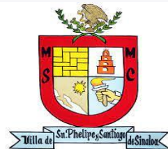
SINALOA DE LEYVA