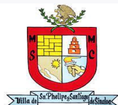
SINALOA DE LEYVA