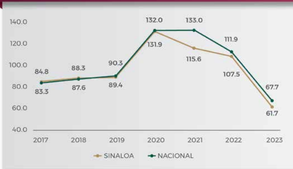
Mortalidad isquémica del corazón Sinaloa - Nacional 2017-2023

En ese mismo sentido, la tasa de mortalidad isquémica del corazón se mantuvo por debajo de la nacional, registrando disminuciones en los últimos 3 años con una tasa del 61.7 por 100 000 habitantes.