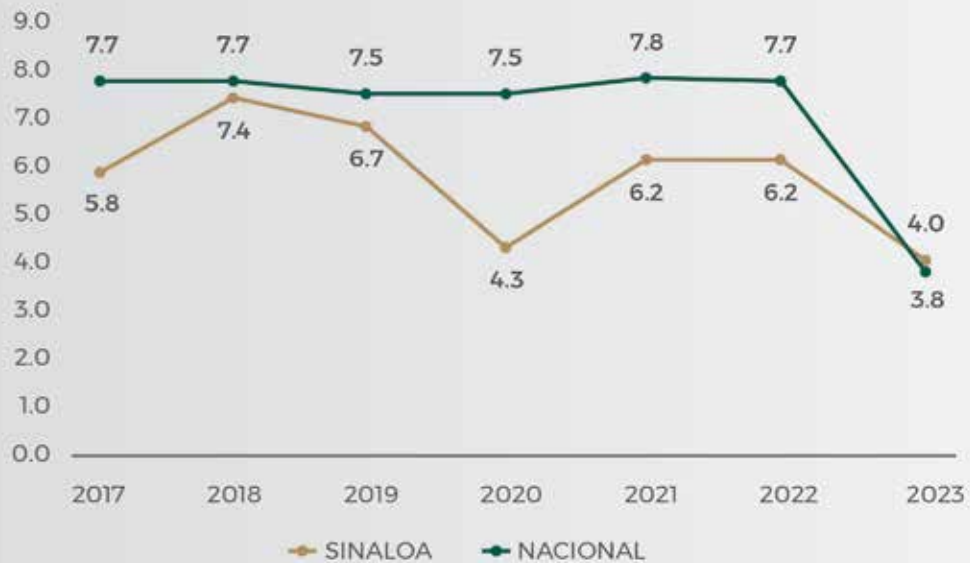
Mortalidad neonatal Sinaloa - Nacional 2017-2023

De 2017 a 2022, el indicador de mortalidad neonatal se mantuvo por debajo de la media nacional; este año se registra una tasa de 4.0 (por 1000 nacimientos).