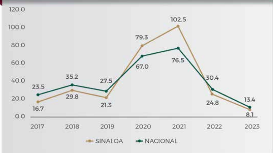
Razón de muerte materna Sinaloa - Nacional 2017-2023

SE REDUJO LA RAZÓN DE MUERTE MATERNA, UBICÁNDOSE EN 5.3 PUNTOS PORCENTUALES POR DEBAJO DE LA MEDIA NACIONAL.